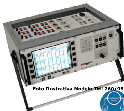
Foto Ilustrativa Modelo TM1760/96